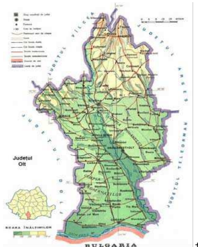
Figura 1: POZITIA GEOGRAFICA A PROIECTULUI

Judetul Olt se afla situat in Regiunea de dezvoltare 4 Sud-Vest Oltenia. Din punct de vedere administrativ, judetul Olt este compus din 2 municipii (Slatina si Caracal), 6 orase (Bals, Corabia, Draganesti Olt, Piatra Olt, Potcoava si Scornicesti) si 104 comune.